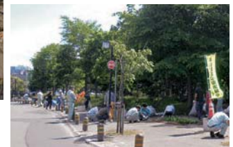
「永山記念公園」清掃活動